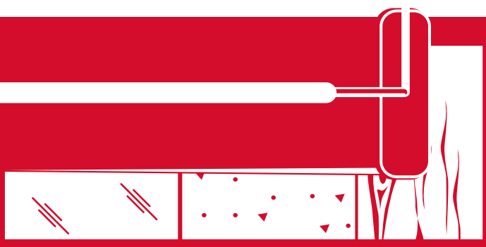
Acier Inoxydable / Métal

* Moyennant une préparation appropriée tel qu'indiqué dans le "GUIDE DE PRÉPARATION DE SURFACES" de PROMA